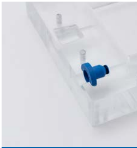
Flowstop in offene Form einlegen, anschließend wird die Form wieder verschlossen.

Der kostengünstige Einwegartikel muss im Vergleich zu anderen Verschlussmöglichkeiten (z.B. Klappen oder Schieber) weder gereinigt noch gewartet werden.