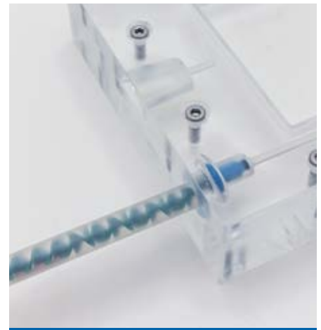
Die Befüllung der Form kann gestartet werden. Durch den Materialfluss öffnet sich der Flowstop.