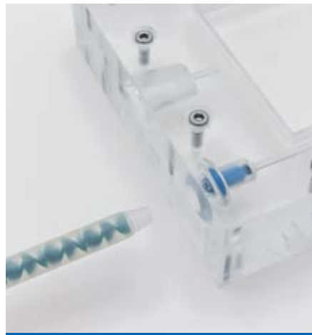
Die Mischerhülse wird vorne gekürzt und soweit in den Flowstop gesteckt, bis sie auf Widerstand stößt.