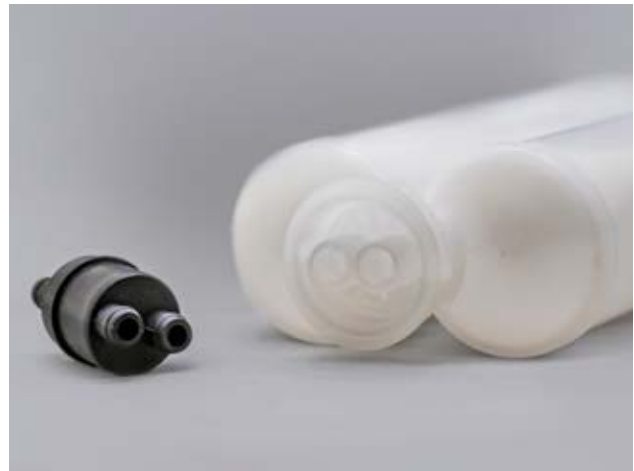
Kartusche mit Adapter: In der neuen Ausführung LC-DCM verfügt der Mischeraufsatz von Tartler über einen universellen Anschlusspunkt für die Kunststoffadapter vieler verschiedener derzeit gängiger Kartuschensysteme.

Neben seinem universellen Adapteranschluss bietet der neue Kartuschenmischer LC-DCM von Tartler noch einen weiteren entscheidenden Vor-