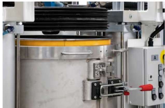
Die 3. Option arbeitet mit einem Vakuumspannfass (TAVA), das wie eine Vakuumkammer funktioniert. Dadurch wird die Erzeugung eines sehr hohen Vakuums (-0,97 bar) im Fass möglich. Die Vorteile: Beim Fasswechsel wird keinerlei Luft in das System eingebracht, und Materialverlust sowie Spritzgefahr ausgemerzt.

Das TAVA 200 D erzeugt und regelt das Vakuum über eine prozessorientiert ausgelegte Steuerung. Die Vakuumbeaufschlagung wird erst abgeschaltet, wenn sich absolut keine Luft mehr im System befindet. Alles ist auf maximale Prozessoptimierung und Sicherheit ausgelegt. Das System ist bedienerfreundlich, arbeitet vollautomatisch bietet dem Anwender volle Kontrolle bei null Materialverlust, null Spitzgefahr und null Handarbeit. Im Zusammenspiel mit der intelligenten Maschinensteuerung der Misch- und Dosieranlagen den Bauweisen NODOPOX und TARDOSIL stellt die TAVA 200 D einen neuen Standard bei der Verarbeitung pastöser Polyurethan- und Epoxidharze sowie Silikone auf. Und schon jetzt deutet sich an, dass diese Innovation aus Michelstadt auch die Fasswechselprozesse in anderen Bereichen der Fluidtechnik revolutionieren wird.