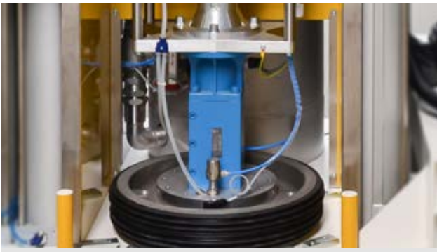
Option 2 ist der Mittelweg. Durch die vakuumunterstützte Folgeplattenentlüftung wird die Prozesssicherheit gesteigert und der Materialverlust reduziert.

terial sitzt. Diese Vorgehensweise beim Fasswechsel ist relativ bedienerfreundlich, verhindert gefährliche Spritzer und minimiert den Materialverlust. Allerdings erfasst die Methode nur die „Schadluft“ über dem Material und es kann kein hohes Vakuum erzeugt werden. Unter den Gesichtspunkten von Prozesssicherheit und Materialeffizienz ist diese Vorgehensweise nicht für alle Materialien geeignet jedoch das derzeit etablierte Verfahren.